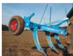
voor- en diepwoelers