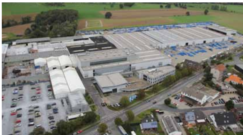
LEMKEN in Alpen/Nederrijn (Duitsland)

Als specialist voor de professionele akkerbouw behoort LEMKEN met meer dan 1.100 medewerkers wereldwijd en een omzet van meer dan 360 miljoen Euro bij de toponderningen van Europa. In 1780 startte dit familiebedrijf als smederij en nu produceert het zowel op de Duitse hoofdvestiging in Alpen als in de vestigingen Föhren en Meppen kwalitatief hoogwaardige en efficiënte landbouwwerktuigen voor grondbewerking, zaaien en gewasbescherming. 72 procent van de circa 17.200 werktuigen per jaar is voor de export bestemd.